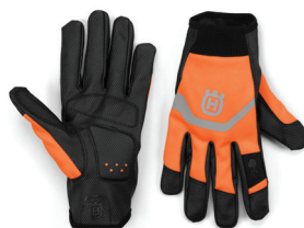
HANDSCHUH FUNCTIONAL LIGHT NON-SLIP 529 88 02-09