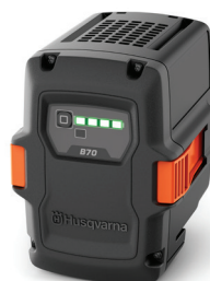
AKKU 40-B70 970 45 71-01