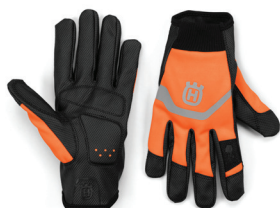
HANDSCHUH FUNCTIONAL LIGHT NON-SLIP 529 88 02-07