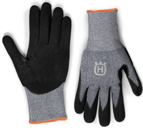
HANDSCHUH TECHNICAL GRIP 529 88 03-12