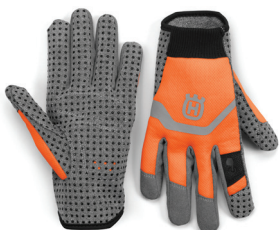
HANDSCHUH FUNCTIONAL LIGHT VENT 529 88 01-08