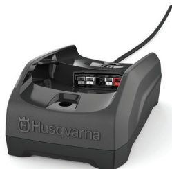
AKKU-LADEGERÄT 40-C80 970 48 78-01