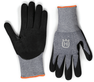
HANDSCHUH TECHNICAL GRIP 529 88 03-10