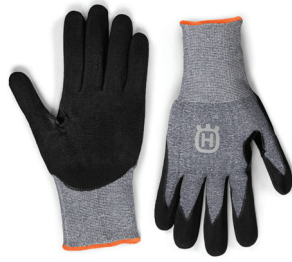
HANDSCHUH TECHNICAL GRIP 529 88 03-08