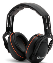
GEHÖRSCHUTZ 505 66 53-04