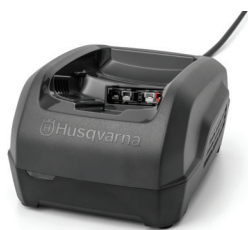
AKKU-LADEGERÄT QC250 967 97 01-01