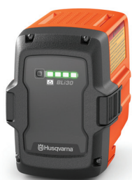
AKKU BLI30 967 93 77-01