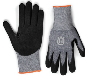
HANDSCHUH TECHNICAL GRIP 529 88 03-09