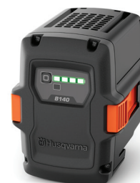
AKKU 40-B140 970 45 72-01