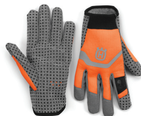
HANDSCHUH FUNCTIONAL LIGHT VENT 529 88 01-10