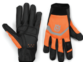
HANDSCHUH FUNCTIONAL LIGHT NON-SLIP 529 88 02-08