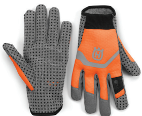
HANDSCHUH FUNCTIONAL LIGHT VENT 529 88 01-07