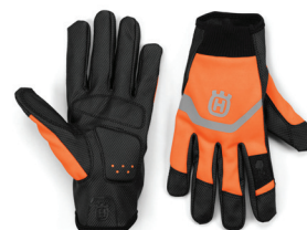
HANDSCHUH FUNCTIONAL LIGHT NON-SLIP 529 88 02-10