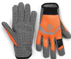
HANDSCHUH FUNCTIONAL LIGHT VENT 529 88 01-09