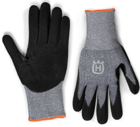
HANDSCHUH TECHNICAL GRIP 529 88 03-07